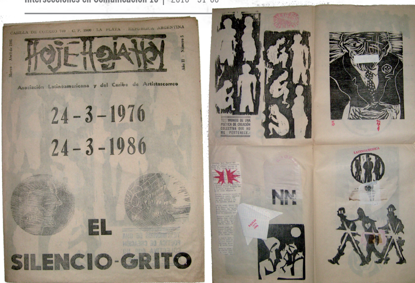
Imágenes 2 y 3: Revista Hoje hoja hoy. Año 2, Nº 5, Marzo-Abril de 1986. En Documentos | Redes Intelectuales en América Latina, Ítem #128. Disponible en: http://redesintelectuales.net/documentos/items/show/128

En algunas revistas conviven ambos formatos: La grieta combina el cuadernillo con otros materiales, como hojas sueltas, o La náusea , que comprende un afiche o “revista mural” y un pequeño cuadernillo denominado “folleto”.